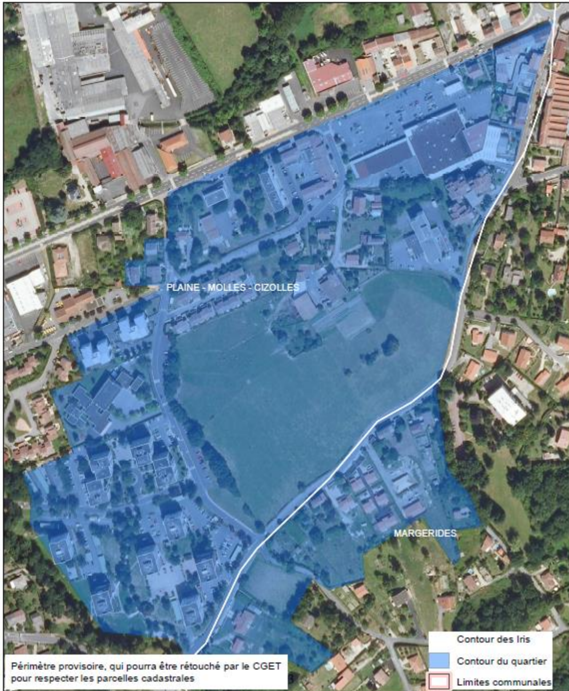
Carte du quartier prioritaire Les Molles Cizolles